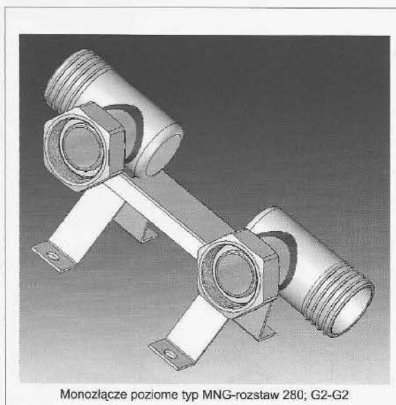
Monozłącze poziome typ MNG-rozstaw 280; G2-G2